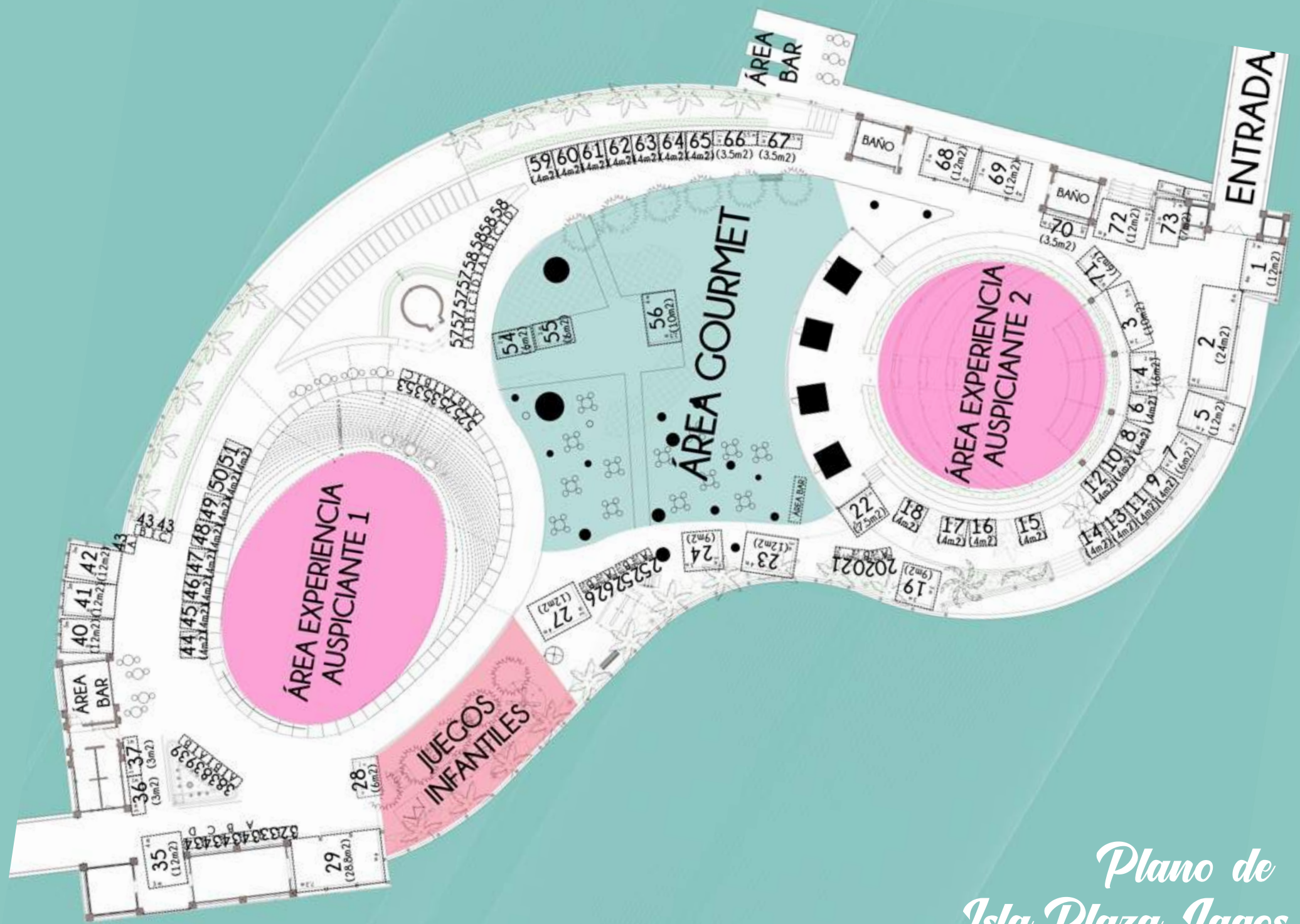
Plano de Isla Plaza Lagos